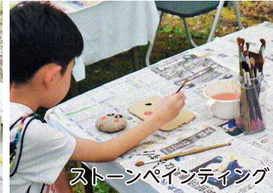
ストーンペインティング