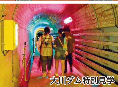
大川ダム特別見学