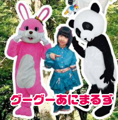
ダークーあにまるず