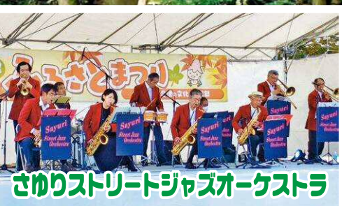
さけりストリートジャズオーケストラ